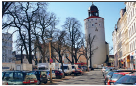
Ungeordnetes Parken beeinträchtigt seit vielen Jahren die Attraktivität des Platzes und des Marktes

Im Februar 2023 sind die Fällungen (Westteil) aus Naturschutzgründen abzuschließen.