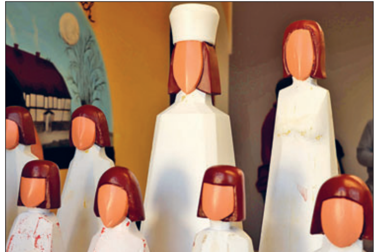
Historische Schachfiguren in der Werkstatt nach der Grundierung und Farbgebung der Gesichter. Es folgt der Farbanstrich der Körper in rot und gelb.