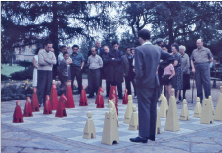
Das Bild aus dem Jahr 1965 zeigt das Schachspiel im Birkenwäldchen, dessen Figuren derzeit im Stadtpark verwendet werden.

Die Schachfiguren werden künftig in unmittelbarer Nähe zum Spielfeld im Stadtpark in gesicherter Form verwahrt sein. Der Schlüssel zum Schrank für die Schachfiguren kann ab April nach Voranmeldung beim Alkanti Tagestreff auf der Jakobstraße 24 in Görlitz ausgeliehen werden.