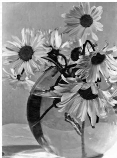
Foto von Herbert Heimann, Stilleben mit Margeriten in Kugelvase von Wilhelm Wagenfeld, 1945, Fotografie (Pigmentdruck)

Herbert Heimann – Fotografien aus den 1920er bis 1950er Jahren: Die Arbeiten des Görlitzer Fotografen sind bedeutende Zeugnisse der Görlitzer Fotografiegeschichte und nur noch bis Mitte März im Graphischen Kabinett im Barockhaus zu sehen. Vorbeischaun lohnt sich.