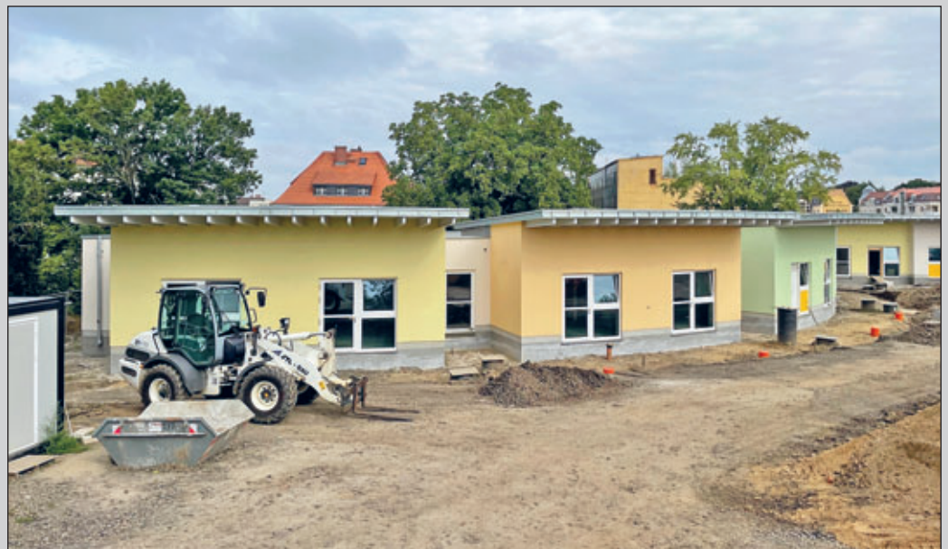
Die Hofansicht der neuen Kita – noch inmitten des Baugeschehens