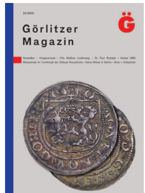
Titelseite des neuen Görlitzer Magazins

Das Görlitzer Magazin ist in den Museumshops der Görlitzer Sammlungen, im Kaisertrutz und im Barockhaus, für 14 Euro erhältlich. Zudem kann es auch online bestellt werden über https://www.goerlitzer-sammlungen.de/goerlitzer-magazin-34.html oder über museum@goerlitz.de