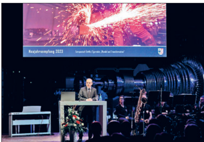
Oberbürgermeister Octavian Ursu bei seiner Rede an die zahlreichen Gäste des Abends